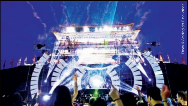
Intro Music Festival Beijing 2015