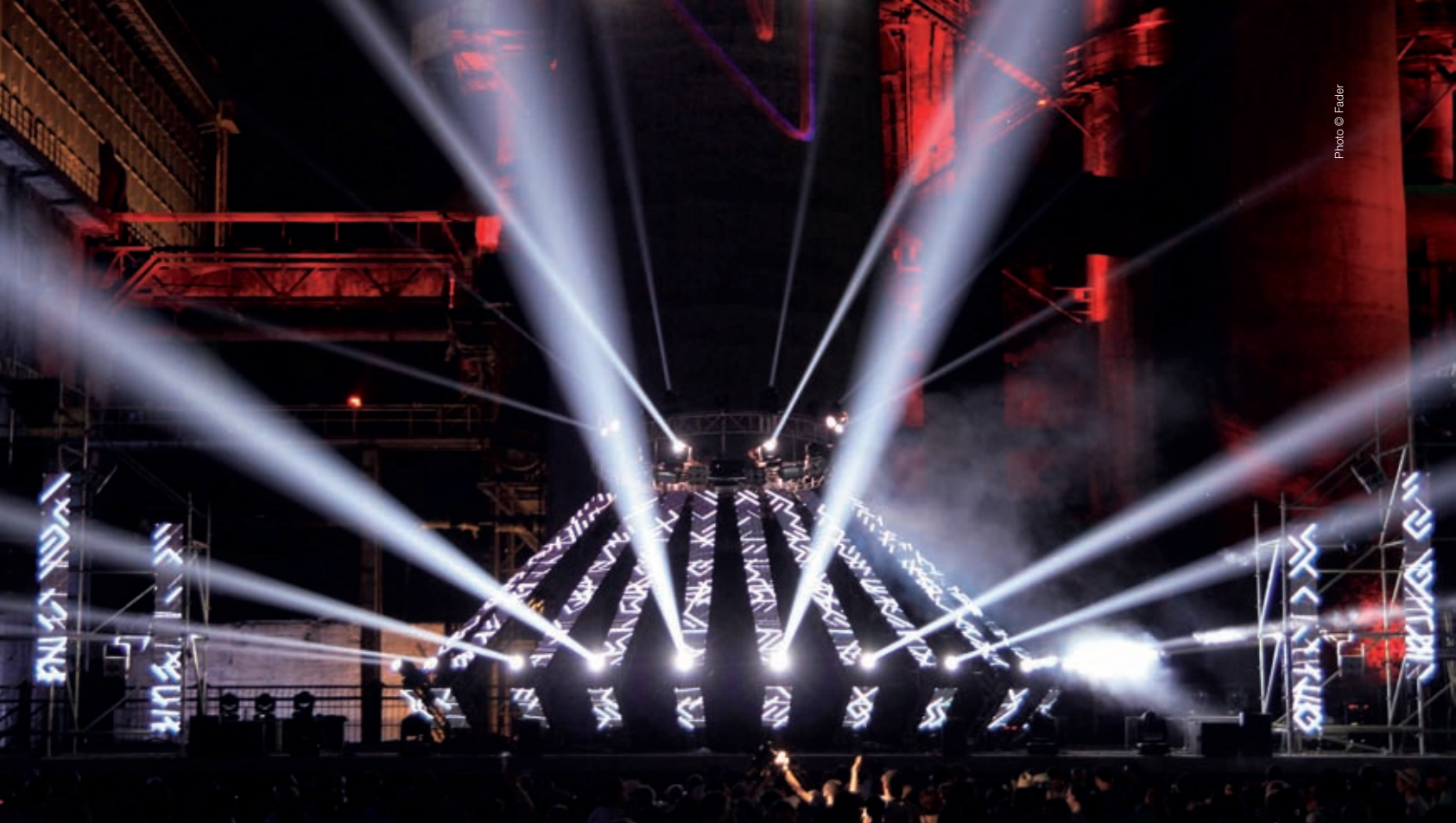
Intro Music Festival Beijing 2013