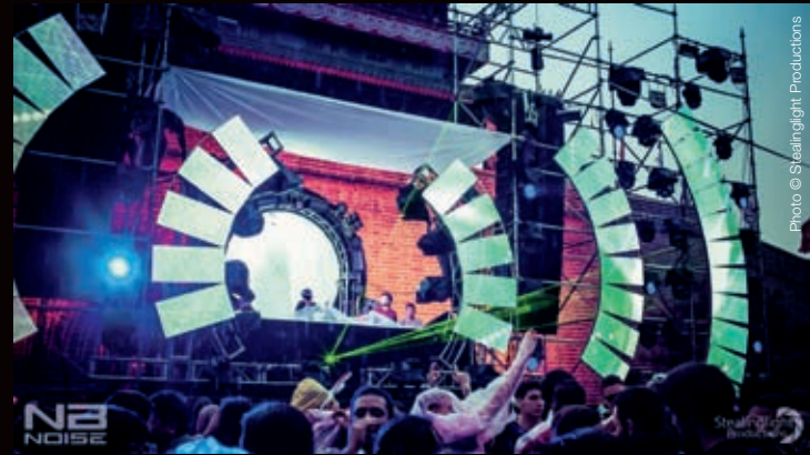
Intro Music Festival Beijing 2015

VJ 페이더 : 요즘 대단한 무대 디자인이 꽤 많다. 세계 곳곳의 여러 음악 축제가 벨기에에서 열리는 투모로랜드를 본보기 삼는다. 투모로랜드는 정교하고 웅장한 공연을 펼치는 행사로 유명하다. 2013년 울트라 음악 축제의 중심 무대 디자인은 상징적이었다. 피라미드 형태에 최신 LED 조명 기술이 들어간 대형 U 로고가 박혔는데, 이때 사용한 U 로고가 그 후에 열린 다른 나라의 울트라 공연에서도 계속 등장한다. 나는 네덜란드에서 열리는 Q-댄스 공연을 무척 좋아하는데 네덜란드인은 파티를 좀 아는 사람들 같다! 그들은 가끔 화난 고릴라나 신비한 동물 같은 강렬한 주제를 선정해서 공연을 기획한다. 하드 스타일 장르를 선호하지 않는 내가 봐도 공연은 환상 그 자체다. 추가로 소개하는 영국 아카디아 축제의 '거미'는 철저히 주문 제작됐는데 DJ 부스를 매달고, 입체 음향 시스템까지 완벽한 무대다. 불꽃과 조명, CO2 분사 장비를 작동하고 공연을