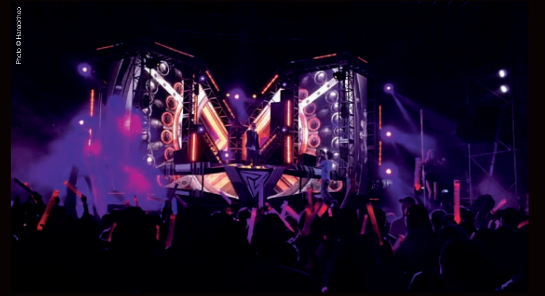
Storm Festival 2014